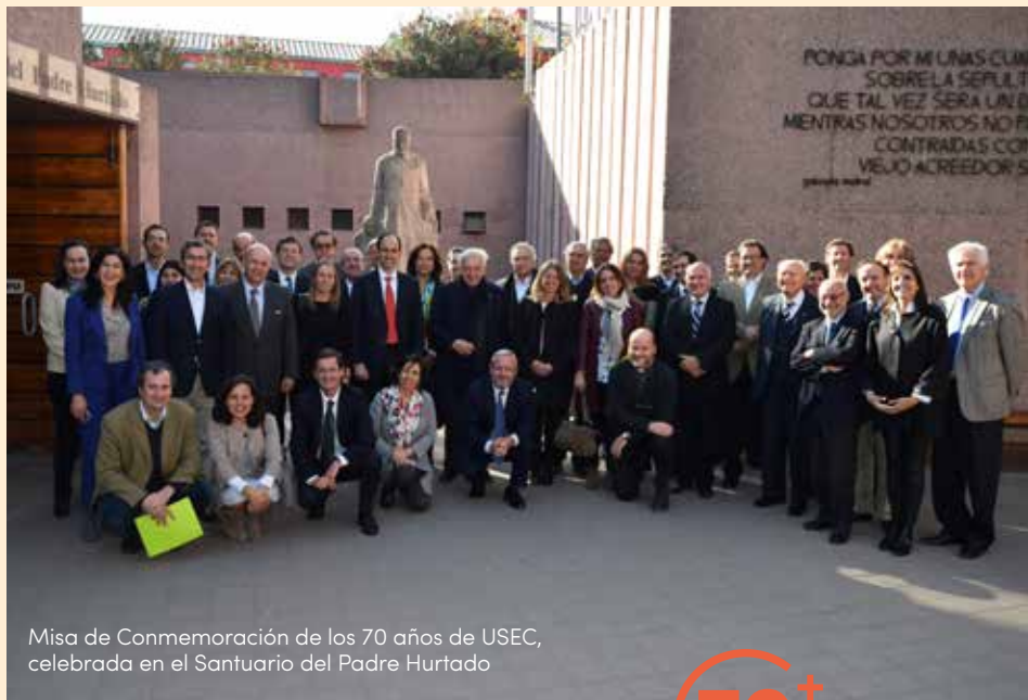
Misa de Conmemoración de los 70 años de USEC, celebrada en el Santuario del Padre Hurtado

Luego, dimos un primer paso para dar a conocer a USEC en regiones, visitando Puerto Varas, Puerto Montt, Valdivia y Punta Arenas. Las visitas, que incluyeron reuniones con empresarios y emprendedores locales y charlas en universidades, tuvieron amplia repercusión en los medios de comunicación regionales.